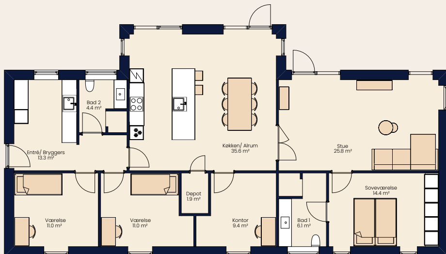
Vinkelhus 160 m 2