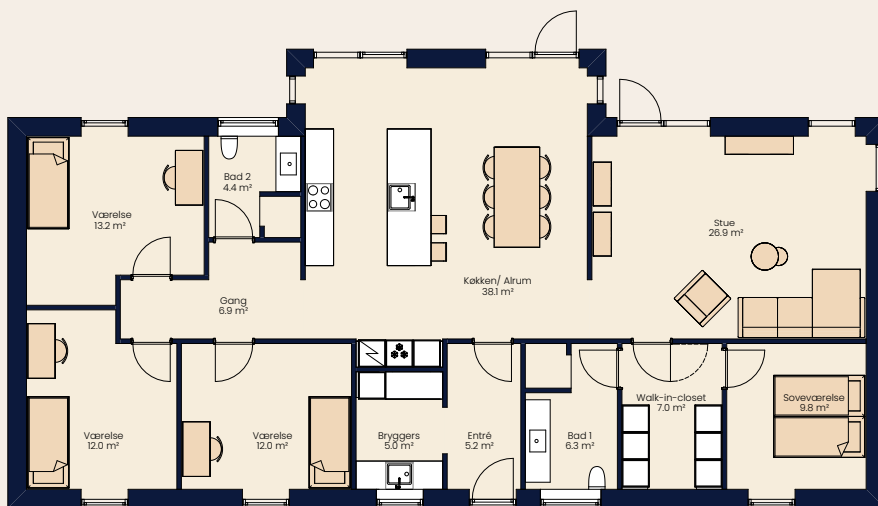
Vinkelhus 175 m 2