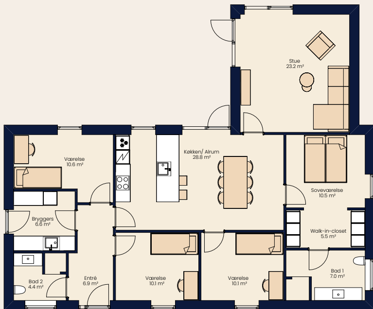
Vinkelhus 151 m 2