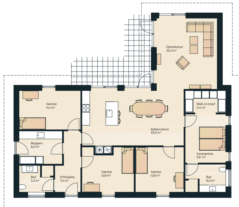
Vinkelhus 172 m 2