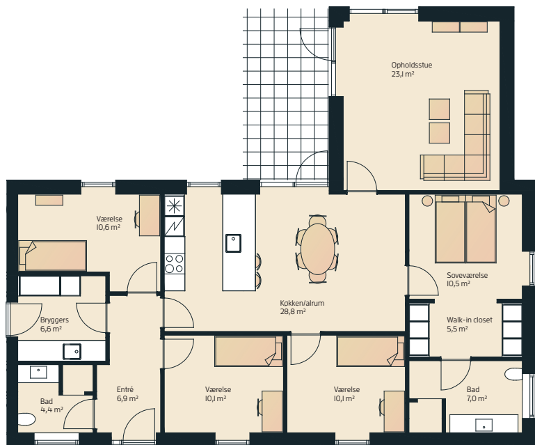
Vinkelhus 151 m 2